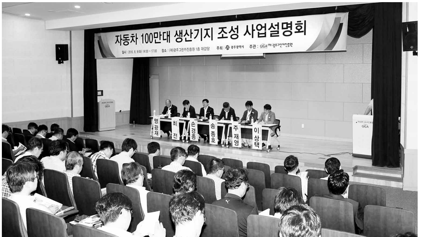
광주시는 지난 9일 (재)광주테크노파크 대강당에서 150여개 자동차 관련 기업 및 유관기관 관계자들이 참석한 가운데 '자동차 100만대 생산기지 조성사업 설명회'를 열었다.