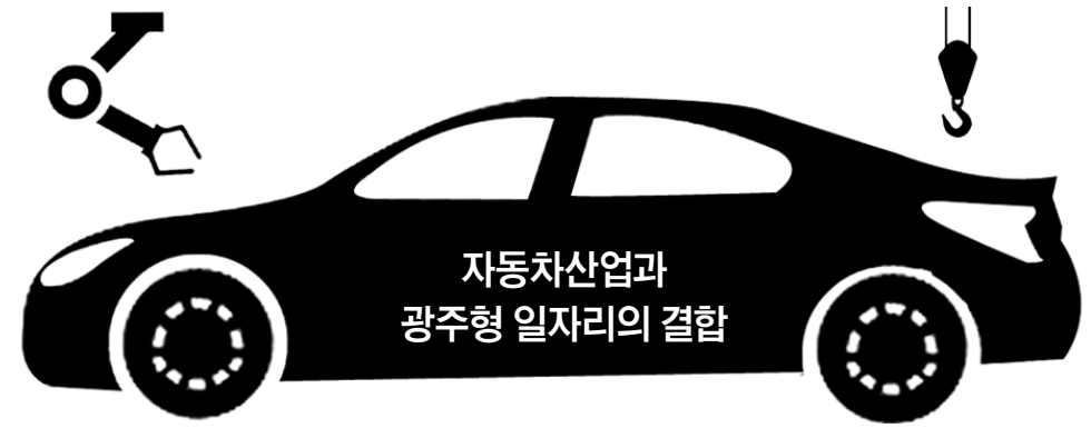
자동차산업과 광주형 일자리의 결합

자동차·문화·에너지 첨단 복합산단 조성 주거·복지·교육시설 갖춘 근로자 복지 실현 초점