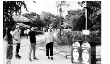
기가 설치돼 있어 스피커를 운영하기 위한 추가 전력도 필요없다는 게 남원시의 설명이다.

17일 남원시에 따르면 지역 환경단체인 '강살리기남원시네트워크'와 함께 친환경 이색쓰레기통은 일반쓰레기와 재활용쓰레기로 분리돼 있으며, 투입구에 쓰레기를 넣으면 새집 모양의 스피커에서 10여 가지의 다양한 국악이 흘러나온다. 쓰레기통 상단에 태양광에너지 발전