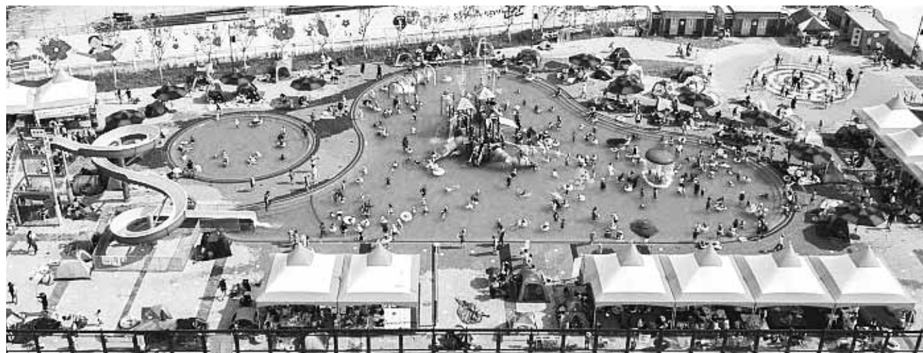
군산시민들이 소풍통에 조성된 야외수영장에서 무더위를 식히고 있다.