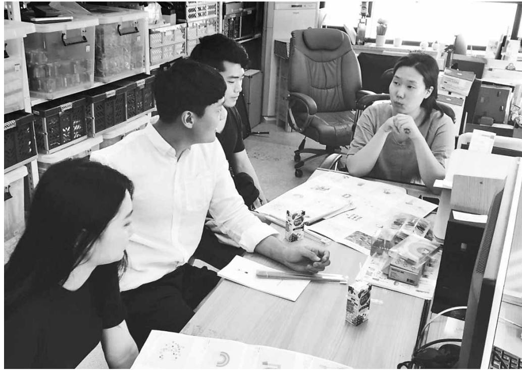
광주대는 학생의 취업·창업 경쟁력 및 글로벌 마인드를 높이기 위한 다양한 프로그램을 마련해 지원하고 있다. '글로벌마케팅' 프로그램에 참여한 학생들이 해외 박람회 앞두고 기업 관계자와 이야기를 나누고 있는 모습. <광주대 제공>

기계·금형공학부는 다양한 역학적 해석과 창의적 설계가 가능한 뿌리산업 기술인력을 키운다는 전략에 따라 신설된 학과다. 융·복합 인재 양성을 위해 전공별 특성화 수업을 진행하며 ▲3D 프린터를 활용한 컴퓨터 설계(CAD, CATIA) 교육 ▲자동차공학 ▲나노 및 바이오공학 ▲기계 및 에너지시스템 설계 교육 등을 폭넓게 실시한다. 50명을 모집하는데 수시에서 48명을 뽑는다. 기계·금형공학부는 한국금형산업진흥회, 광주