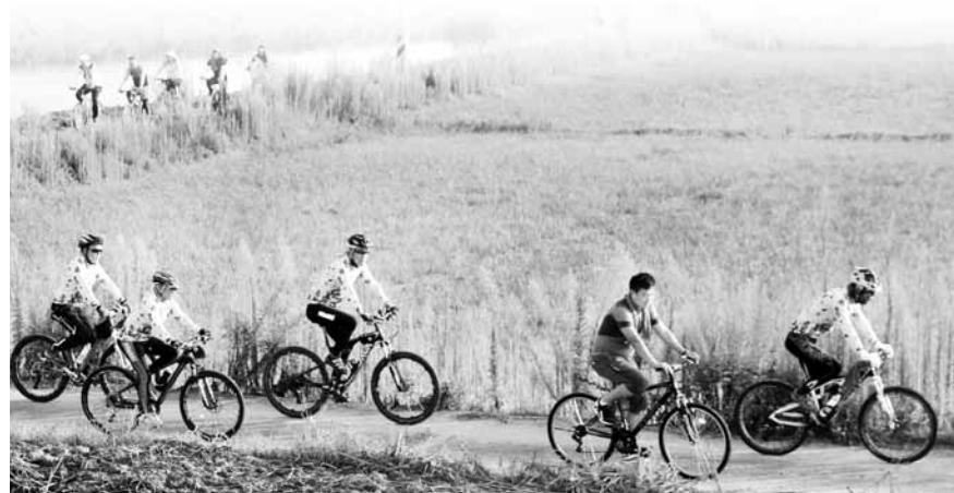
강진만 자전거 여행 참가자들이 강진만 갈대숲에서 라이딩을 즐기고 있다.

를 구입하고, 자전거가 없는 관광객과 향우, 군민들에게 당일 선착순 무료로 대여하고 있다. 행사 이후에도 평소 자전거를 탈 수 있도록 사전에 신청을 하면 자전거를 무료로 대여해 준다. 강진군체육회 관계자는 “자전거여행을 통해 군민들이 건강증진과 여가를 즐길 수 있는 좋은 프로그램을 보급해 나가겠다”면서 “앞으로도 군민들의 생활체육 분야 참여율을 높여 나갈 계획”이라고 말했다. 자전거여행은 강진군체육회 홈페이지( http://www.gangjinsports.co.kr ) 또는 전화 (061-434-7330)로 연락하면 언제나 신청이 가능하다. /강진=남철희기자 chou@kwangju.co.kr