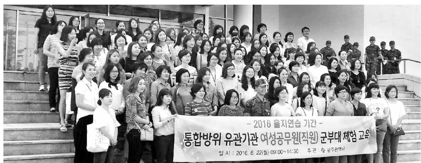
여성공무원 1일 군 체험

교류 캠프는 광주·대구 간 달빛동맹 우수 민간 사례로, 지난 2000년부터 시작해 교류 16년째를 맞았다. 캠프에는 시설 아동과 교직원 50여 명이 참여하며 여름캠프, 교육, 직업 체험 등 다채로운 행사로 진행될 예정이다.