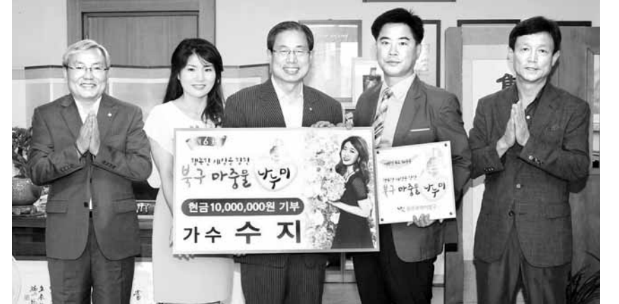
광주 출신 연예인 ‘수지’는 최근 복구 ‘마중물 나누미’ 캠페인에 참여해 부모(왼쪽 두번째·네번째)를 통해 1000만원을 기부했다.