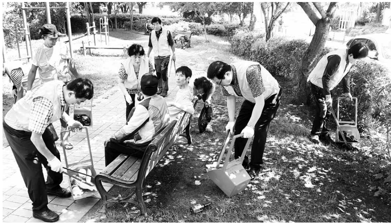
우리 마을 깨끗이 생태문화마을만들기 사업을 진행 중인 두암종합사회복지관 두암골커뮤니티센터는 자발적으로 봉사동아리를 조직해 마을 주변 취약지역에 대한 환경정화활동을 하고 있다.

문의 동천동 주민센터 062-350-4603. /김형호기자 khh@kwangju.co.kr