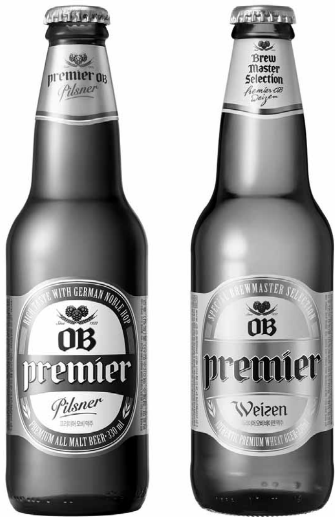
'프리미어 OB'(왼쪽)와 첫번째 브루마스터 셀렉션 '프리미어 OB 바이젠'

밀·보리맥아 50%씩 함유 '바이젠' 세계 최대기업 'AB인베브'와 합작 독일 황실 양조장 사용 효모 고집 호주·미국 등 국제품평회 잇단 수상