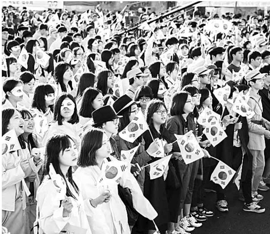
지난해 군산 근대역사박물관과 월명동 일대에서 열린 군산시간여행축제에서 참가자들이 전통·근대 복장을 착용하고 독립만세 퍼레이드를 하고 있다.

을 찾는 모든 분이 주인공이 되어 근대로 돌아가는 시간 여행을 즐기며 추억을 쌓고