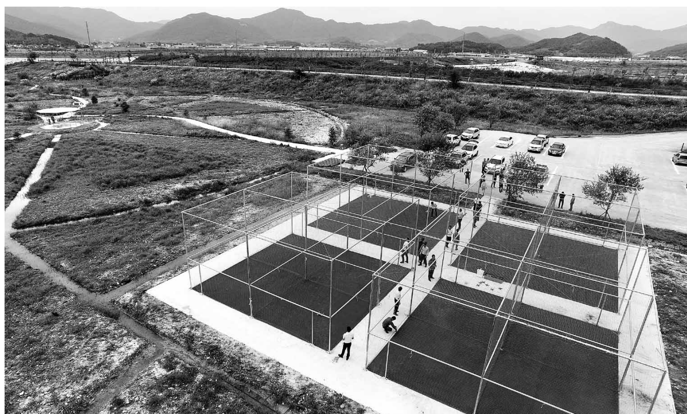
담양 드론 체험장 내달 4일부터 운영 29일 담양읍 영산강 상류에 위치한 담양 홍수조절지 내에 드론 체험교육장이 조성돼 다음달 4일부터 본격적인 운영에 들어간다. 1만1000㎡ 규모(축구장 면적의 1.5배)로 조성된 드론 체험교육장은 30명을 동시에 수용할 수 있는 실내 교육장과 초급·중급사용 체험장, 동호인들을 위한 레이싱경기장 등을 갖추고 있다. <익산지방국토관리청 제공>

‘솔루스 HA31’은 사계절용 타이어로 옆면에 모든 계절에 적합함을 나타내는 태양, 눈, 구름 아이콘들을 삽입하고 방향성 있는 패턴디자인으로 주행성능을 강화했다. /김대성기자 bigkim@kwangju.co.kr