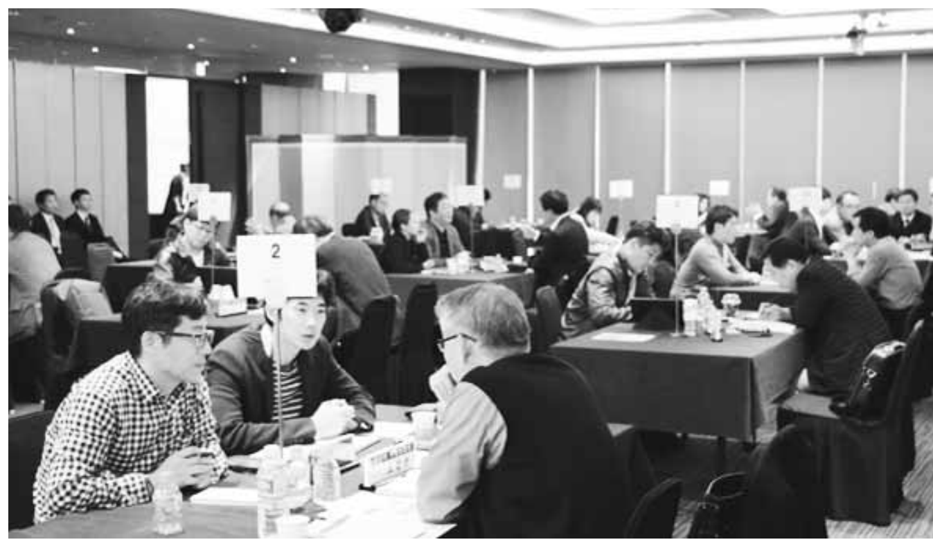
산단공 광주전남지역본부는 지난 5월 전경련 수출멘토단과 함께 수출상담회를 개최하는 등 지역 기업이 협소한 내수시장에서 벗어나 해외시장으로 진출할 수 있도록 지원하고 있다.

이러한 성과는 FTA 전문가(관세사)와 무역상사 경력을 보유한 코트라 수출 전문 인력을 지역본부에 상주시키는 등 상시수출 지원체계를 구축해온 것이 크게 작용했