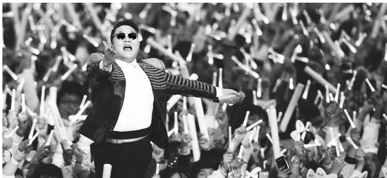
대중문화 시대의 가장 화려한 결실은 '스타'다. 스타성(홍행성과 끼)과 연기력, 대중성(인기), 외모 등 요소에 따라 '스타'의 생명력이 좌우된다. 전 세계에 '케이 팝'(K-POP) 열풍을 일으킨 사이의 공연 모습.

절함으로 쓴 책"이라고 밝혔다. 이 책은 ▲스타지망생의 열풍 현황과 문제 ▲스타화 메커니즘, 핵심주체들 ▲스타마케팅 ▲스타의 존재기반, 팬과 팬클럽 등 9개 장으로 나눠 한국 대중문화 속 '스타'의 빛과 그림자를 날카롭게 분석했다. 연예인 지망 광풍이 불기 시작한 때는 1990년대이다. 대중문화 시장이 급성장하고 연예기획사 중심의 스타시스템이 정착되던 때이다. 방송국 공채 외에도 이력서, 오디션 등을 통해 연예계에 데뷔하는 사례가 늘었다. 또한 저자는 요즘 부쩍 늘어난 연예인의 일탈이 연예기획사 교육·육성 시스템의 문제에서 기인한다고 지적한다. 연예