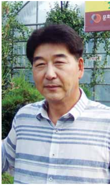
호두와 관련해서는 ‘국내 최초’라는 ‘타이틀’을 가장 많이 가지고 있다. 우선, 국내 최초로 귀족호도나무를 직접

생산하면서 제조부터 유통, 전시, 체험, 축제행사로 이어지는 6차산업의 ‘롤모델’ 역할을 하고 있다.