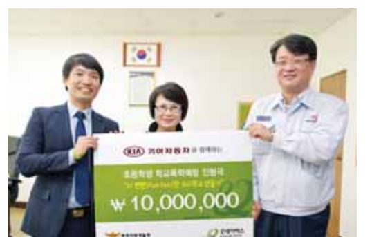
서는 조기교육이 필요하다는 판단에서 이번 후원을 하게 됐다”며 “다양한 사회공헌활동을 통해 지역사회 발전에 이바지하겠다”고 밝혔다.

기아차는 이날 광주지역 초등학교 저학년들을 위한 학교폭력 근절 예방 프로그램에 써달라며 1000만원을 전달했다. 기아차 관계자는 “점차 연령대가 낮아지는 학교폭력 문제를 해결하기 위해