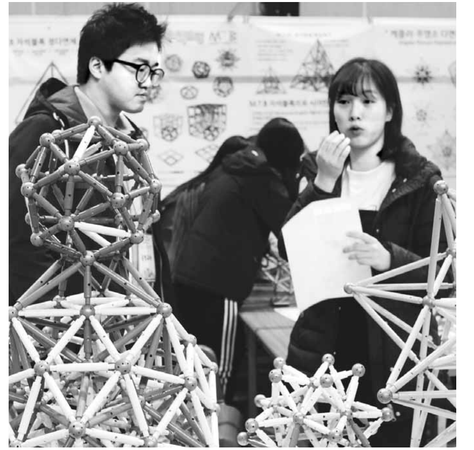
지난해 열린 광주과학축전 행사장을 찾은 학생들이 체험 부스를 둘러보고 있다.