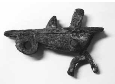
전통무기 쇠뇌 방아쇠 부분인 노기.

연구소측은 올해 수중지층탐사기(SBP, Sub-Bottom Profiler)로 해저면 하부를 정밀 탐사하고 이상체가 확인된 지점과 유물 집중매장처로 추정되는 곳을 조사했다. 과거 사람 시아와 족각에 의지했던 조사 방식에서 한단계 더 나아가 최신 장비를 도입함으로써 향후 조사가 기대되고 있다.