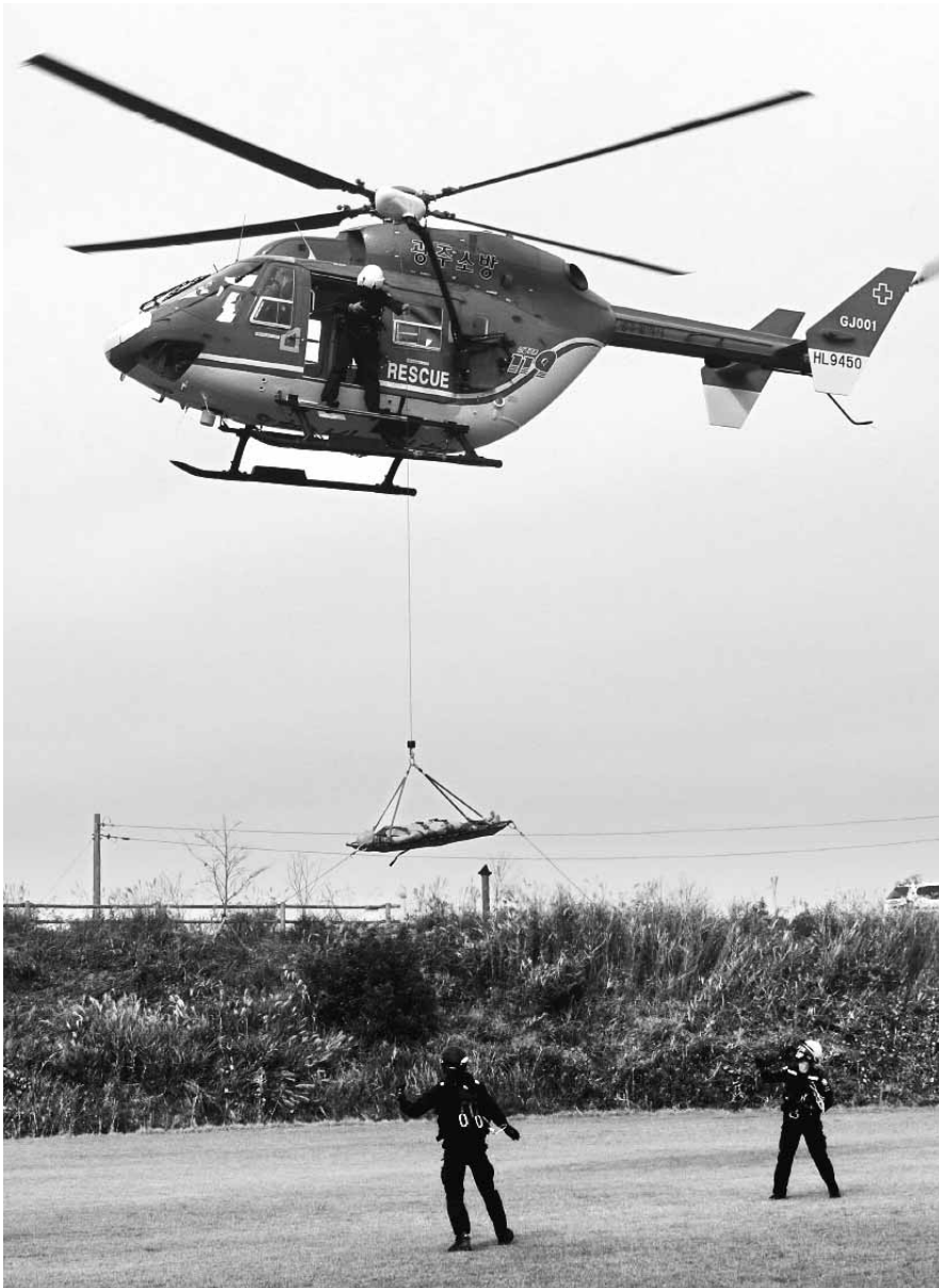
산불진화 훈련 광주시소방안전본부는 산불화재 발생 시 신속한 대응을 위해 20일 광산구 송산유원지에서 소방헬기를 이용한 산불진화 및 항공구조 훈련을 했다.

신청은 어린이집 소재지 관할 구청에 하면 된다. 관할 구청의 1차 확인을 거쳐 광주시 공공형 어린이집 선정심사단에서 최종 선정하며 선정 결과는 11월22일 광주시 홈페이지(www.gwangju.go.kr)에 공고될 예정이다. /채희종기자 chae@kwangju.co.kr