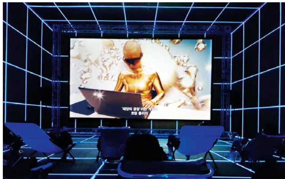
▲히토 슈타이얼 작 '태양의 공장' 가상현실속 의인화 프로그램 사살...현대사회 정보왜곡 풍자