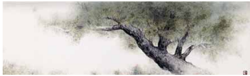
오창록 작 '기다림-만귀정'

입구에서는 작품설명 등을 담은 워크북을 판매(1000원)하고 있으며 홈페이지에서 무료로 다운받을 수도 있다. 문의 062-608-4114. /김용희기자 kimyh@kwangju.co.kr