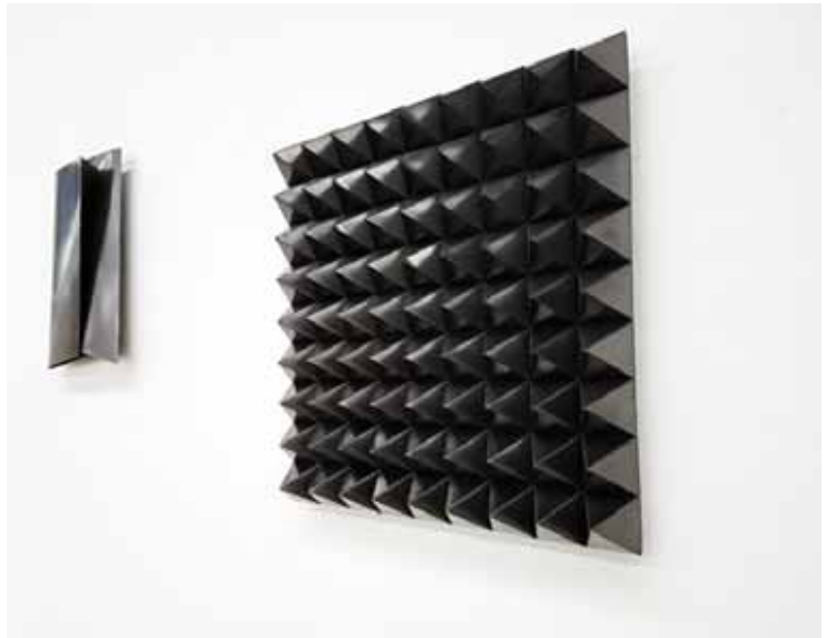
▲로렌스 아부 함단의 '고무 도포 강철' 이스라엘, 팔레스타인 청소년 사살 사건 소재

'2016 광주비엔날레'(11월6일까지)가 2주밖에 남지 않았다. '제8기후대-예술은 무엇을 하는가?'를 주제로 펼쳐지는 올해 비엔날레는 37개국 101작가(팀)가 참여해 현대미술작품 252점을 전시하고 있다. 최근 비엔날레재단은 SNS '페이스북'(www.facebook.com/GwangjuBiennale) 카드뉴스를 통해 전시팀 추천작 18선을 게시했다. 이를 토대로 놓치지 말아야 할 작품을 소개한다.