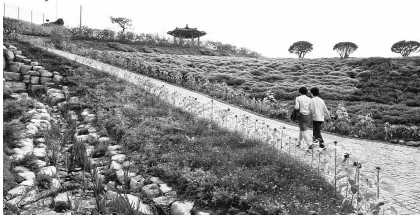
화순군은 27일부터 11월 6일까지 '2016 도심속 국화향연'이 펼쳐지는 화순 남산공원에 화단용 국화 10만주 등 총 18만주의 가을꽃을 식재했다.

건강이라는 테마에 적합한 차별화된 대표 축제로 육성하고, 지역의 농특산물 판매와 관광자원을 연계해 지역경제를 활성화할 계획이다.