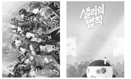
타르타로스 샬리의 법칙