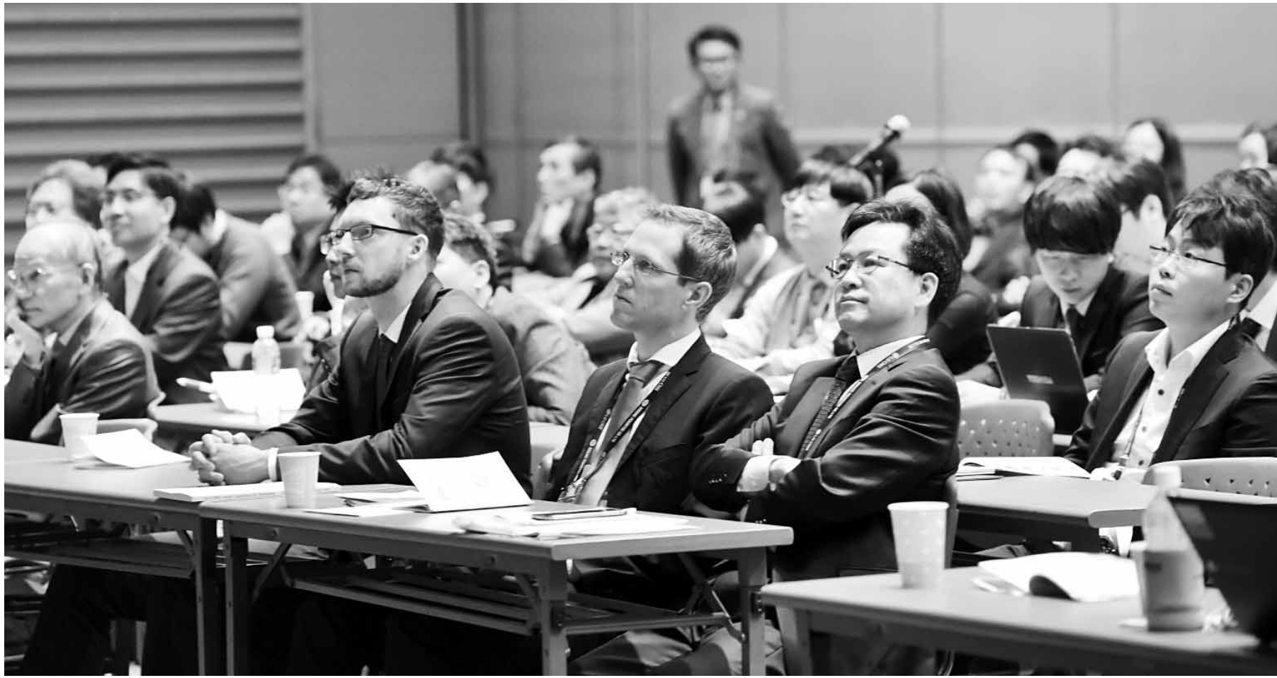
한국전력이 오는 11월 2일부터 4일까지 광주시 김대중 컨벤션 센터에서 빛가람 국제전력기술 엑스포(BIXPO 2016)를 연다. 지난해 열린 BIXPO 2015의 모습.