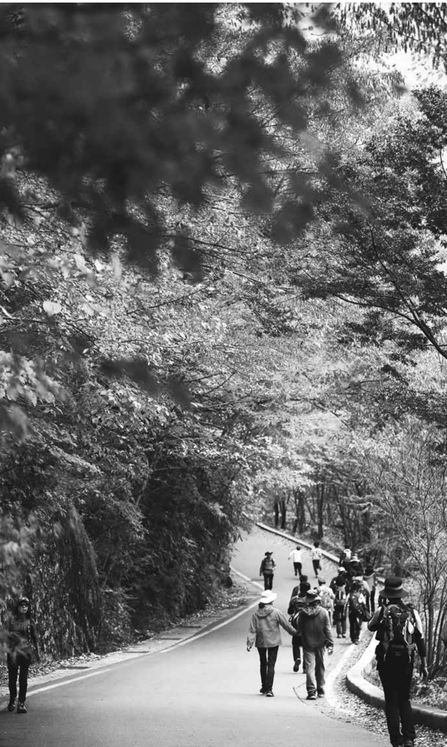
지리산 피아골 단풍 절정 가을 나들이철을 맞아 지리산을 찾은 탐방객들이 피아골 단풍숲길을 걷고 있다. 단풍 명소인 지리산 피아골에서는 지난 29~30일 '삼총(三叢)과 함께하는 오색단풍여행'을 주제로 '제40회 지리산피아골단풍축제'가 열렸다. /구례=이성구기자 lsg@

신청자에 한해 휴관일인 월요일을 제외한 평일동안 해당 프로그램을 운영하고 있다. 또 소록도 성당 및 마리아노·마가렛 사택 역시 여행주간 주말(토, 일) 순천에서 출발하는 고흥 시티투어 버스 탑승객을 대상으로 체험기회를 제공한다. 고흥군은 이외에도 이순신 오토나부터 청령채널 및 테마의 섬 스탬프 투어 등 다양한 여행주간 프로그램을 운영하는 한편 발포역사전시체험관, 고흥우주전문과학관, 원시체험의 섬 시도도 등 군 지역 주요 공공 시설에 한해 여행주간 동안 50% 할인혜택에 나서고 있다. /고흥=주각중기자 gjuu@