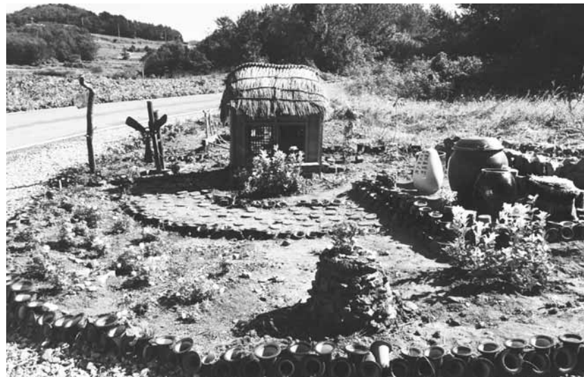
고흥군 동이면 백양리에 조성된 한 평 정원.

집배원들이 직접 방문해 거주생활 실태를 점검하기도 했다. 이를 통해 2000여건의 보일러, 전기장판, 수세식 화장실 등 점검이 이뤄졌으며, 보수가 필요한 사항을 고흥군 해당 부서에 직접 전달해 생활민원을 해결하는 데 중요한 기초자료로 활용되고 있다. 고흥군 관계자는 "앞으로도 고흥우체국과 지속적인 협업을 통해 주민 생활불편 사항을 발굴해 나가면서 안부살피기 등 맞춤형 민원복지 서비스를 적극적으로 펼쳐 나가겠다"고 밝혔다. /고흥=주각중기자 gjuu@