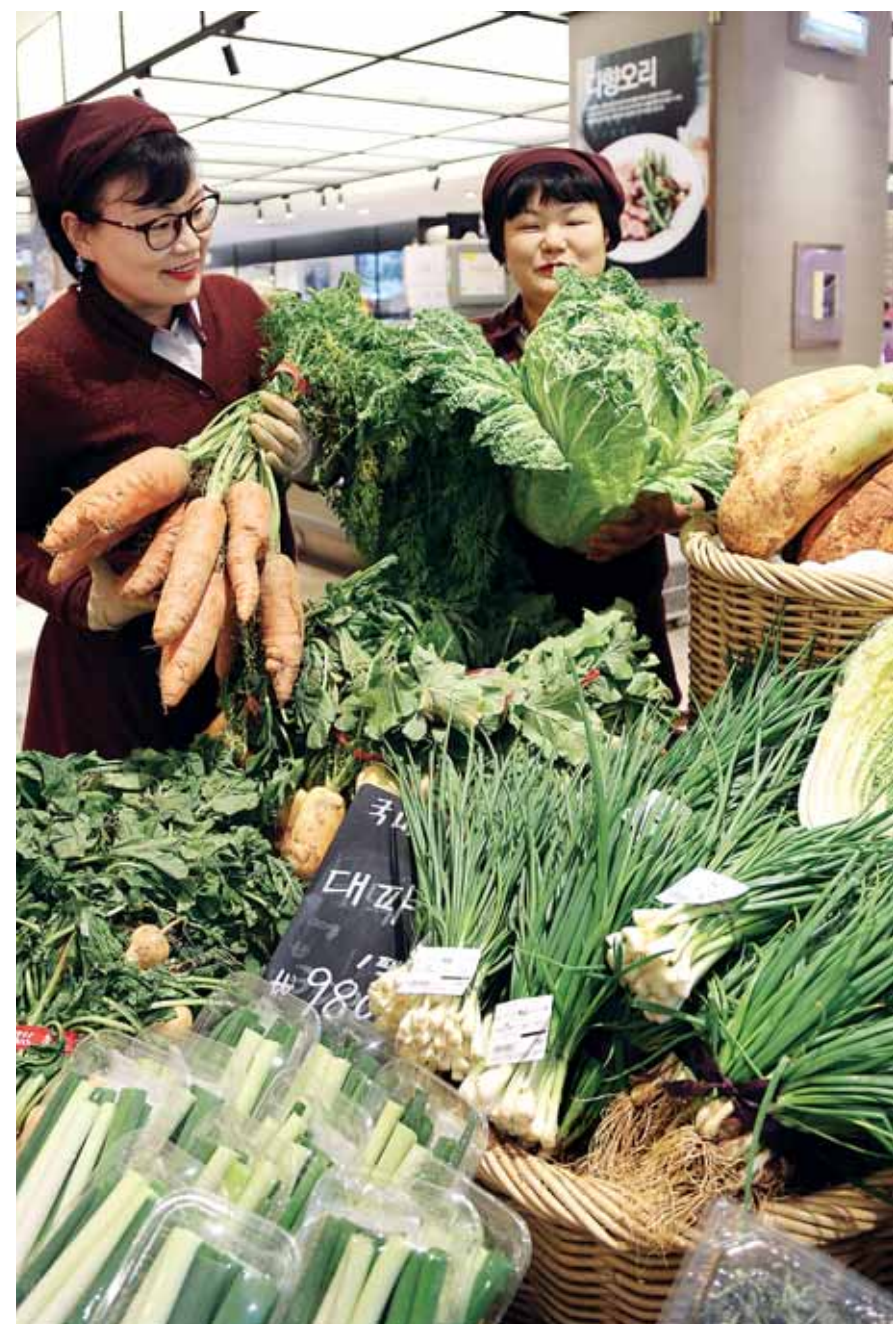
"알뜰하게 김장준비 하세요" 21일 광주신세계(대표이사 임훈) 지하 1층 식품행사장에서 점원들이 배추 등 김장 재료를 살펴보고 있다. 이 백화점은 오는 27일까지 김장 관련 상품을 저렴하게 판매하는 '김장김치 상품전'을 연다.