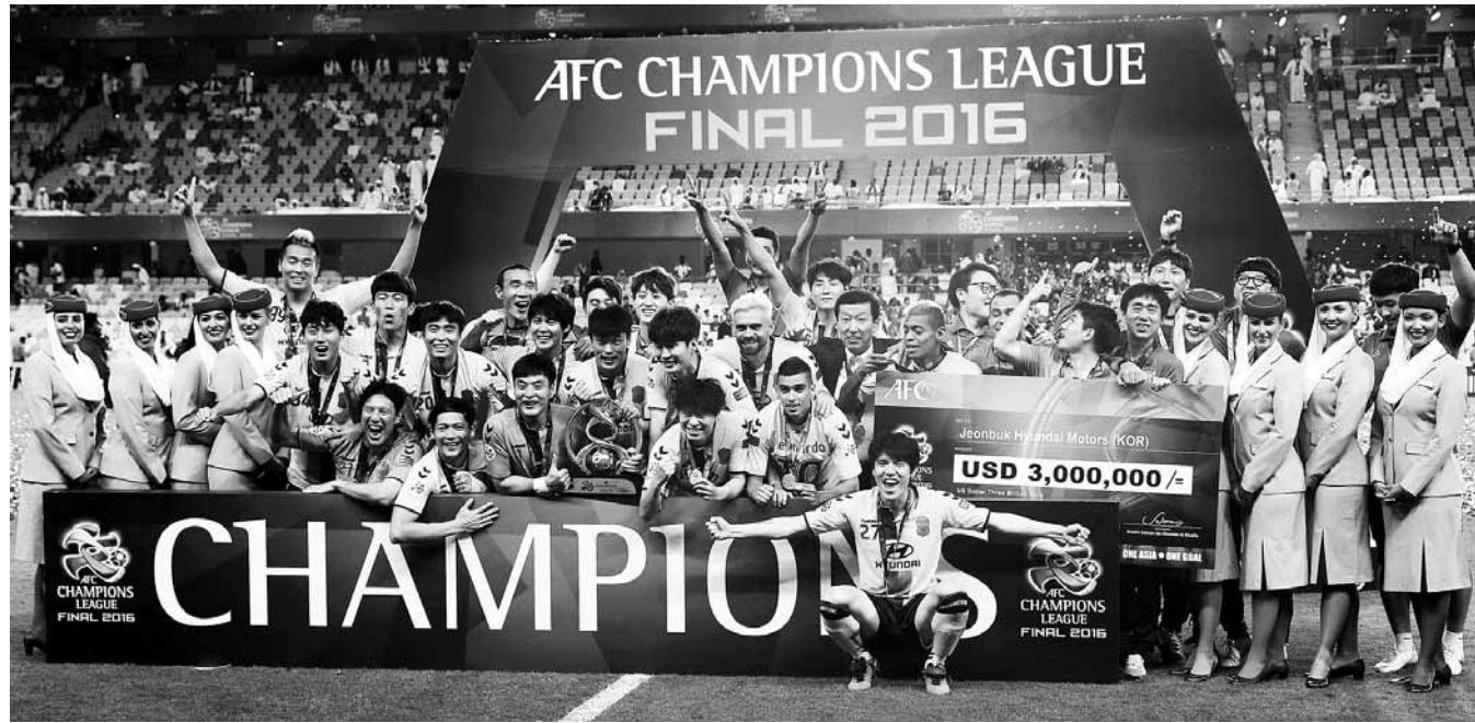
26일 오후 아랍에미리트 알아인 하자 빈 자예드 스타디움에서 열린 아시아축구연맹(AFC) 챔피언스리그 시상식에서 우승을 차지한 전북 현대 모터스 선수들이 트로피를 들고 환호하고 있다.

전북은 2016 AFC 챔피언스리그 우승팀 자격으로 10년 만에 세계 무대에 다시 선다.