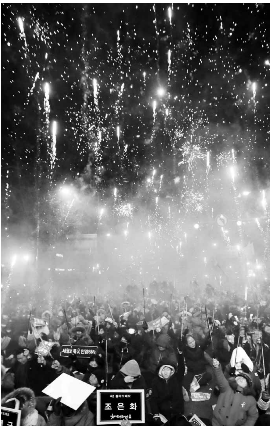
박근혜 대통령 퇴진 촉구 7차 촛불집회가 열린 지난 10일 오후 시민들이 서울시 종로구 효자 치안센터 부근에서 폭죽을 터뜨리고 있다. /연합뉴스

1~3차 촛불집회의 경우 서울 집회 참석자만 집계됐다는 점을 감안하면 전국 참가자 숫자가 실제론 750만명을 훨씬 넘어