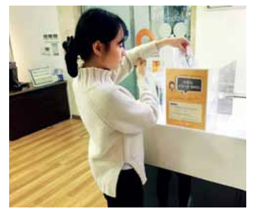
밝은안과21병원에 설치된 안경기부함에 한 어린이 집에서 쓰지 않는 안경을 넣고 있다.

모인 안경은 나눔코리아를 통해 세척한 뒤 수선을 거쳐 기부자 이름으로 가나, 몽골, 베트남