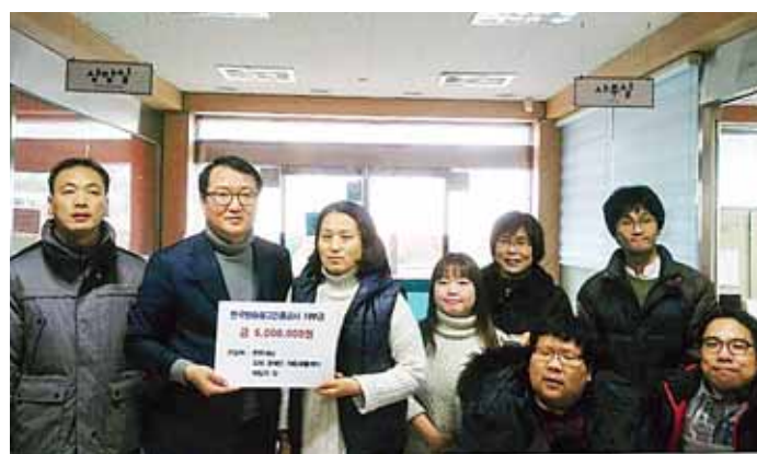
코바코 광주지사는 지상파 방송광고 판매를 대행, 지역 방송광고산업의 중추적 역할을 수행하고 있는 기관이다.