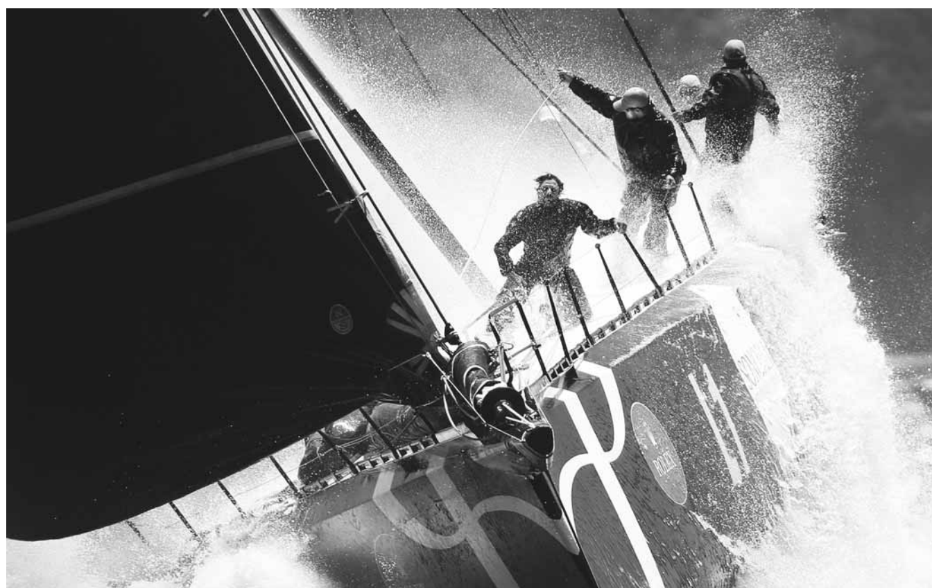
628해리 요트 여정 26일 호수 시드니에서 열린 '롤렉스 시드니 호버트 요트레이스 2016' 참가자들이 요트 항해를 하고 있다. 세계 3대 요트대회로 꼽히는 이번 대회에는 88척의 요트가 시드니에서 628해리(약 1163km) 떨어진 태즈메니아 섬 호버트 항으로 항해한다.

해커는 "나를 믿어준 팀에 감사하다. 한 팀에서 좋은 동료들과 이런 경험을 계속 이어갈 수 있게 돼 매우 기쁘다"며 "2017시즌 팬들에게 더 좋은 모습을 보여줄 수 있도록 잘 준비하겠다"고 소감을 밝혔다.