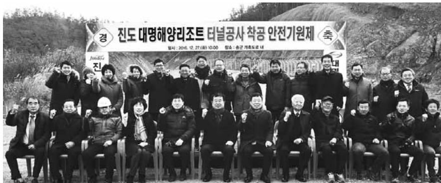
대명해양리조트는 27일 진도군 의신면 공사 현장서 안전기원제를 열고 공사에 돌입했다. 위는 진도 대명해양리조트 조감도.