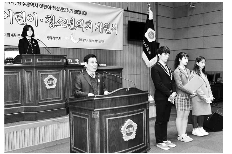
지난 18일 광주시의회 본회의장에서 열린 광주 어린이·청소년의회 개원식에서 윤장현 광주시장이 인사말을 하고 있다.

이날 회의에서 위원들은 '광주 100년 숲길'을 도심지와 연결하기 위해 도심 1도 낮추기, 빗물순환사업과 연계해 추진하는 방안을 제안했다. 아울러 도시화로 인해 사라진 윤림·양림·방림·덕림·서림 등 광주 5림의 마을 숲의 옛 모습 자료를 수집해 상징적인 복원 방안을 마련할 필요가 있다고 강조했다. 노원기 광주시 공원녹지과장은 "광주 초록도시 거버넌스" 운영을 통해 시민과 소통하며 시민을 위한 현안중심의 공원녹지 행정을 펼치겠다"고 말했다. /최권일기자 cki@kwangju.co.kr