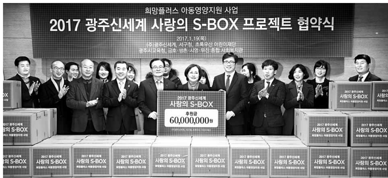
19일 광주신세계는 서구청 상황실에서 '2017 광주신세계 사랑의 S-BOX 협약식'을 갖고 이 지역 100가구에 매달 500만원, 연간 6000만원에 달하는 반찬과 과일 등이 담긴 '패키지 박스'를 전달하기로 했다.

광주신세계가 지역 저소득층에게 매달 반찬과 과일 등을 배달하는 사회 공헌 활동을 한다. 광주신세계는 19일 서구청 상황실에서 '2017 광주신세계 사랑의 S-BOX 협약식'을 갖고 이 지역 100세대에 매달 500만원, 연간 6000만원에 달하는 식재료 박스를 전달하기로 했다. 'S-BOX'에는 사과, 호두, 간편식사, 마른 반찬 및 간식류 등이 담겨 결혼이동이나 차상위계층 가정의 아이들이 식사를 거르지 않고 손쉽게 해결할 수 있도록 했다. 광주신세계가 새롭게 기획·추진하는 사회공헌활동이며 광주시 교육청, 서구청 그리고 서구 관내 4개 복지관(금호·쌍촌·무진·시영)과 연계해 결혼이동 가정 및 차상위 계층을 돕기로 했다. 또 광주신세계는 후원 대상 100세대 중, 결혼 아동 8세대를 선정, 광주신세계 부서별 1:1 결연도 하고 따뜻한 사