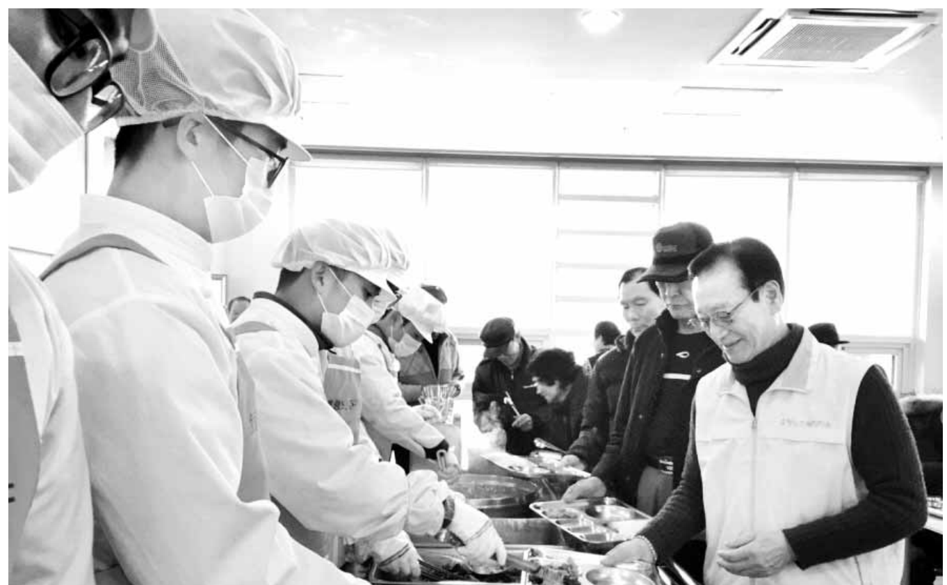
31사단 장병들 배식 봉사 육군 31사단 503보병여단 장병들이 지난 1일 효령노인복지타운에서 점심 배식을 하는 등 다양한 봉사활동을 펼쳤다.

광주시는 시민들의 재난에 대한 경각심을 높이고, 올바른 재난대응능력 배양을 위해 운영 중인 '찾아가는 재난안전교실'에 참여할 강사를 공개 모집한다. 이 교실의 신청분야는 재난대응, 실습(심폐소생술 등), 생활안전 3개이며 신청 자격은 해당분야 강의에 필요한 자격증 소지자(국가·민간자격증), 해당분야 강의 경험자이면 된다. 신청방법은 광주시 홈페이지 고시·공고에서 강사지원서를 내려받아 작성한 후 교안과 함께 10일까지 시 안전정책관실 안전문화교육팀으로 팩스(062-613-4929)나 이메일(gimhp9254@korea.kr)로 제출하면 된다. 심사를 거쳐 선정된 강사는 3월부터 광주시 재난안전교실 강사로 관내 주민센터, 초등학교, 중학교, 유치원, 어린이집, 노인당 등을 찾아가 재난대처요령 등을 교육하고 소정의 강사수당도 지급받는다. /채희종기자 chae@kwangju.co.kr