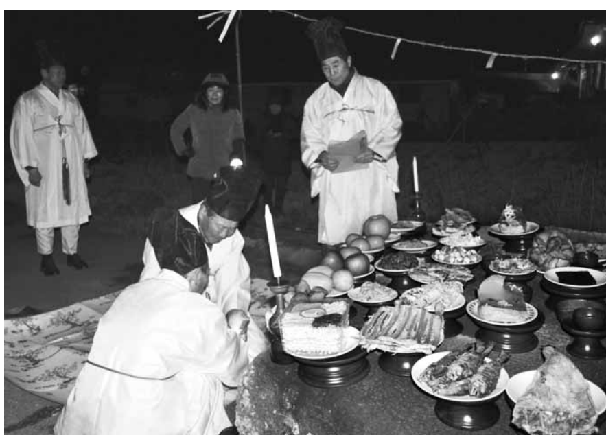
화순 아사리 은행나무 당산제

월14일), 전남은 강진 당전마을·삼인리 비지나무 당산제, 고흥 신금마을 당산제, 완도 예송리 당제·정도리 산신제, 지리산 남악제, 화순 아사리 은행나무 당산제, 담양 봉안리 은행나무 당산제·대치리 느티나무 당산제 등이다. 지난달 27일 '고흥 외나로도 상록수림'(천연기념물 제362호)에서 펼쳐진 신금마을 당산제를 시작으로 오는 10일 정월대보름을 맞아 화순 아사리, 담양 봉안리, 강진 당전마을, 완도 정도리에서 행사가 진행된다. 오는 12월까지 전국 14개 시·도(48개 시·군·구)에서 개최되며 행사 당일 현장을 방문하면 누구나 참여할 수 있다. /김용희기자 kimyh@kwangju.co.kr