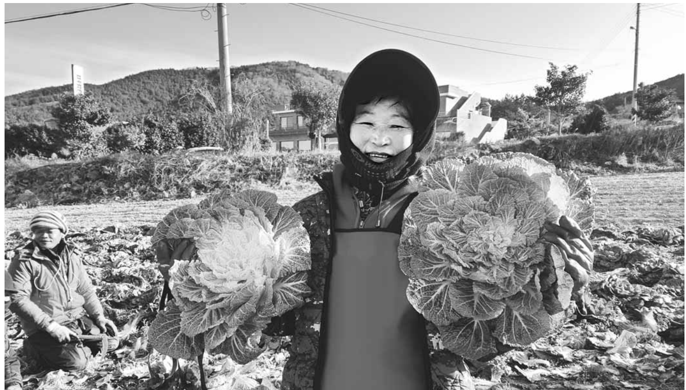
완도군 청산도에서 한 농민이 제철을 맞은 '봄동'을 양손에 들고 활짝 웃고 있다.