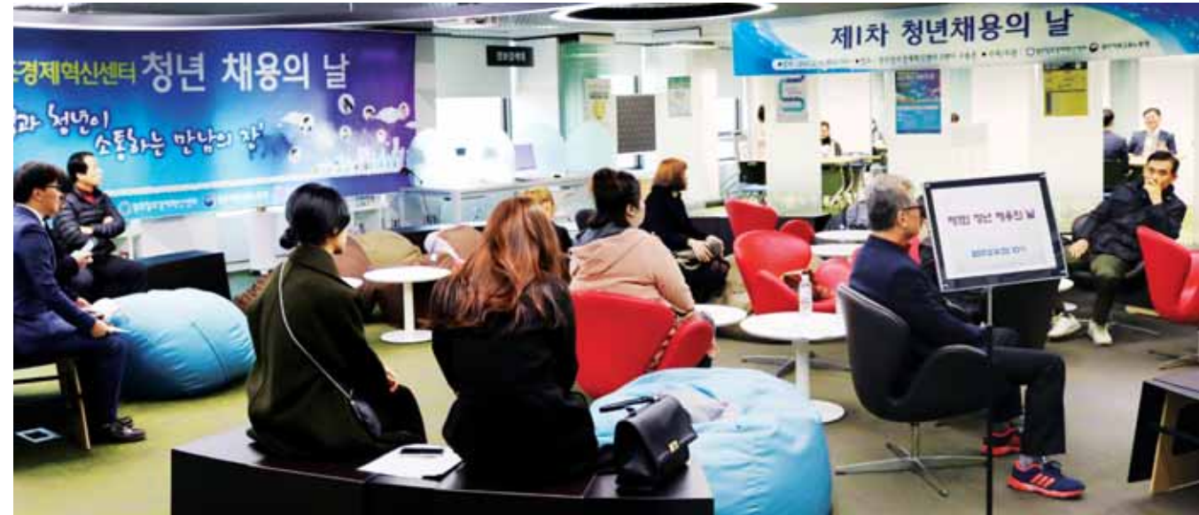
‘청년 채용의 날’ 14일 광주시 서구 양동 KDB생명빌딩 16층 고용존에서 열린 광주청정경제혁신센터(센터장 유지호) 올해 제1차 청년 채용의 날 행사에서 청년 구직자들이 채용 면접을 기다리고 있다.

이는 두 노선의 우등버스(2만6100원·3만4200원)보다는 1.3배가량 비싸지만, KTX(5만9800원·4만7100원)보다는 저렴하다. 김대성기자bigkim@