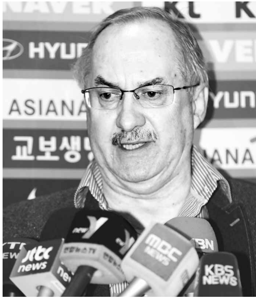
우리 슈틸리케 축구 국가대표팀 감독이 20일 인천국제공항으로 입국해 취재진의 질문에 답하고 있다.

다음은 슈틸리케 감독과 일본일단. -주전 선수들의 결장이 많은데. ▲항상 그래 왔지만 선수들의 결장을 아