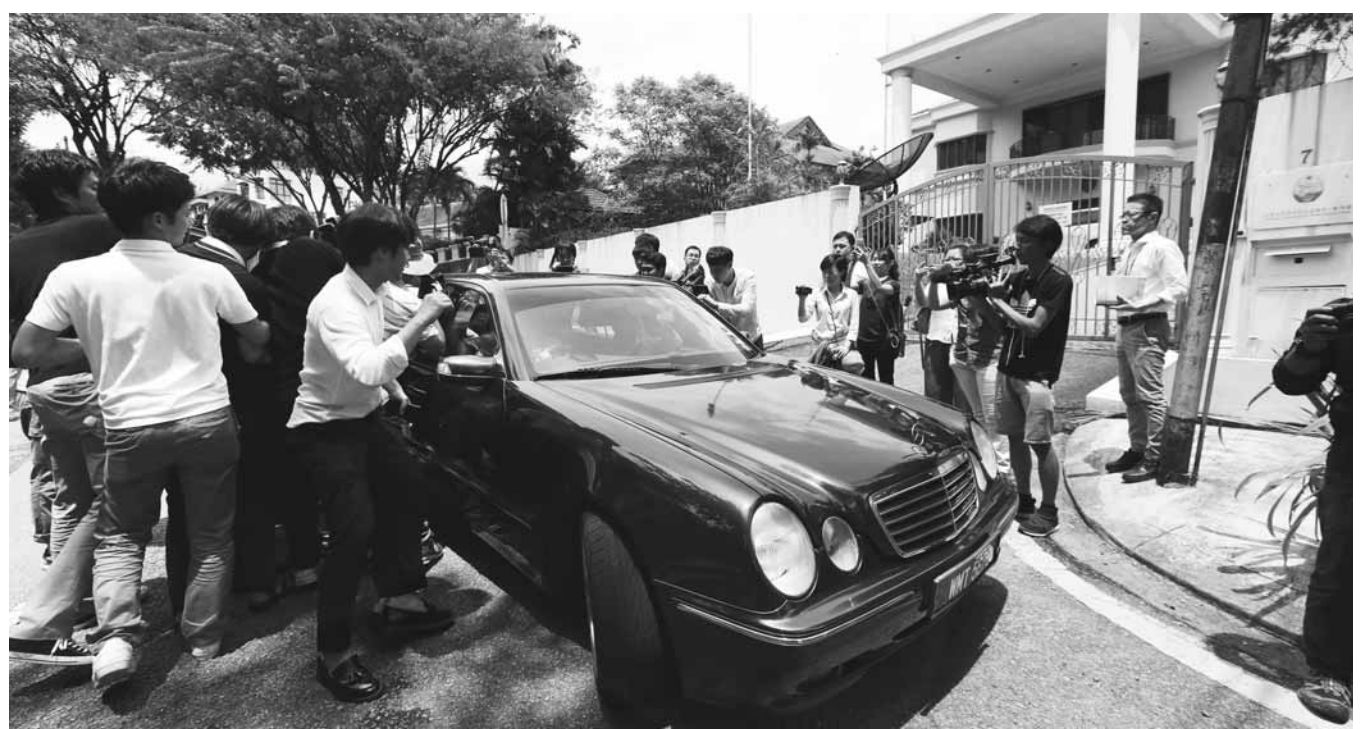
김정남 암살을 실행한 여성 용의자 2명이 탄 차량이 22일(현지시간) 말레이시아 주재 북한대사관에서 나오자 기자들이 취재하고 있다.