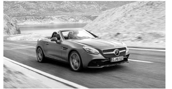
메르세데스-벤츠 '더 뉴 SLC 200'.