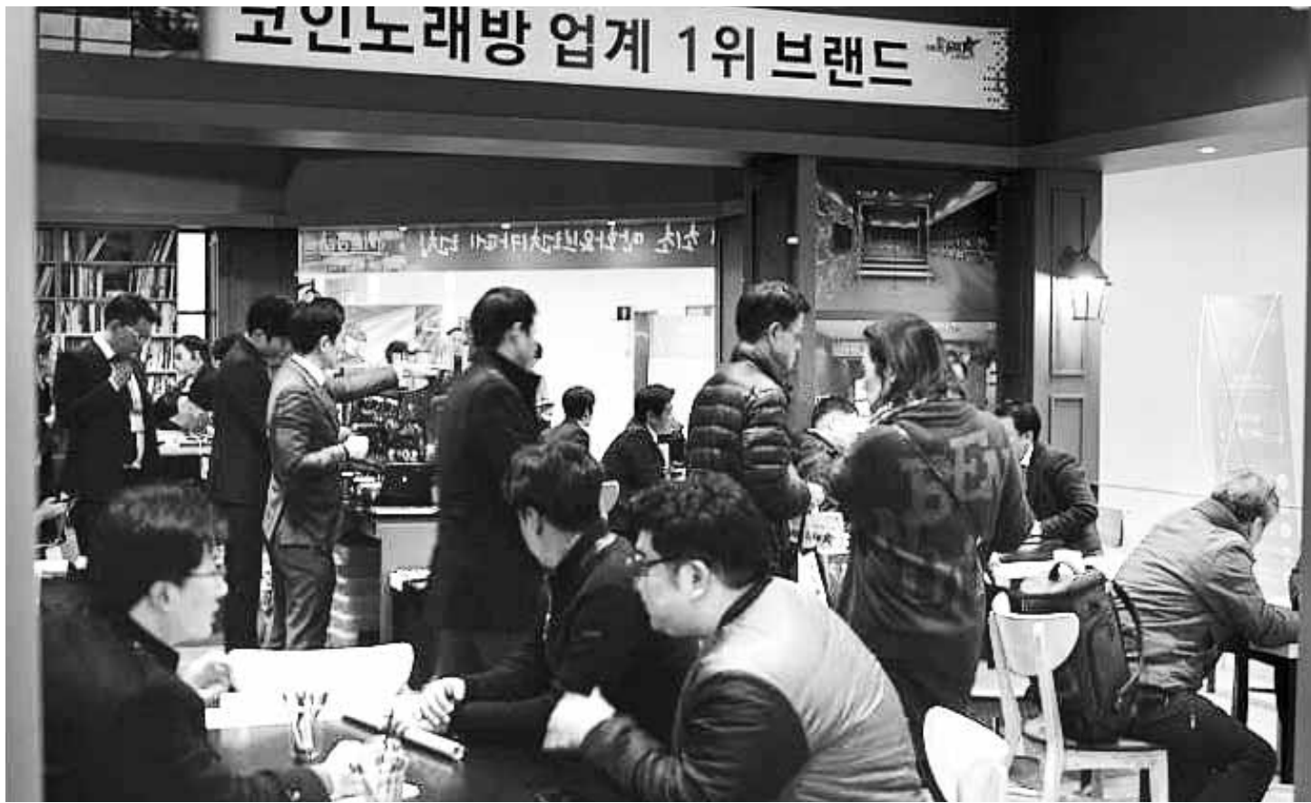
최근 장기적인 경기 불황으로 창업을 준비하는 이들이 늘면서 창업 시장을 이끄는 새로운 트렌드로 1인가구 레저 창업이 영향력을 확대하고 있다. 지난 3일 서울 삼성동 코엑스에서 열린 '2017 프랜차이즈 서울' 코인락스타 부스에 예비 창업자들의 발걸음이 북적였다.