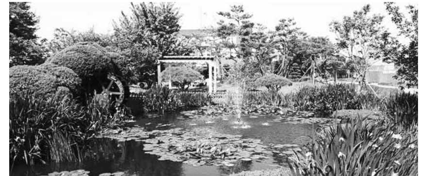
광주환경공단 제1하수처리장에 조성된 생태 연못.