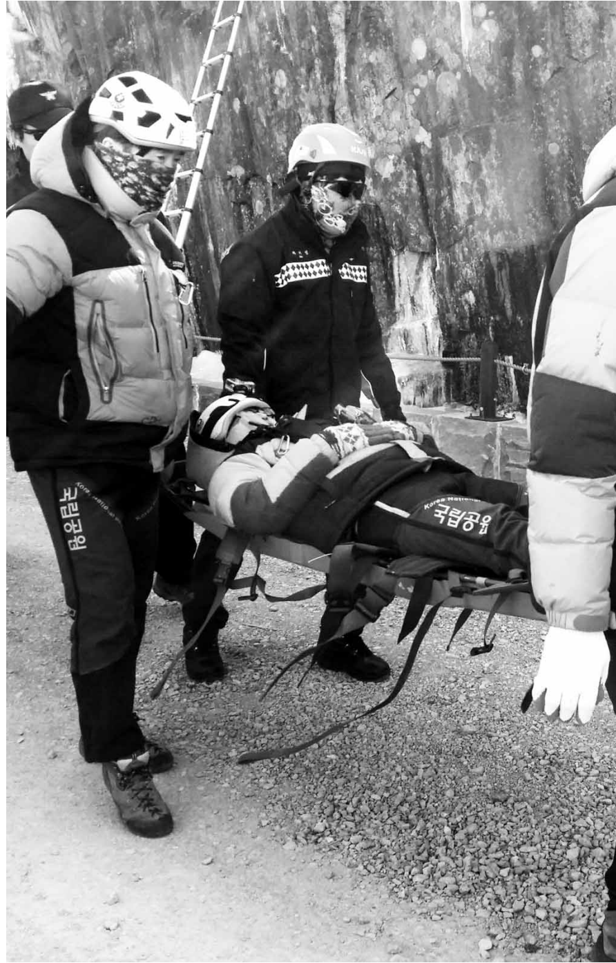
변덕 많은 날씨 등산 조심 광주시 소방안전본부 119산악구조대는 최근 불철 등산객이 늘어남에 따라 산악사고가 증가할 것에 대비, 인명구조 훈련을 실시했다.