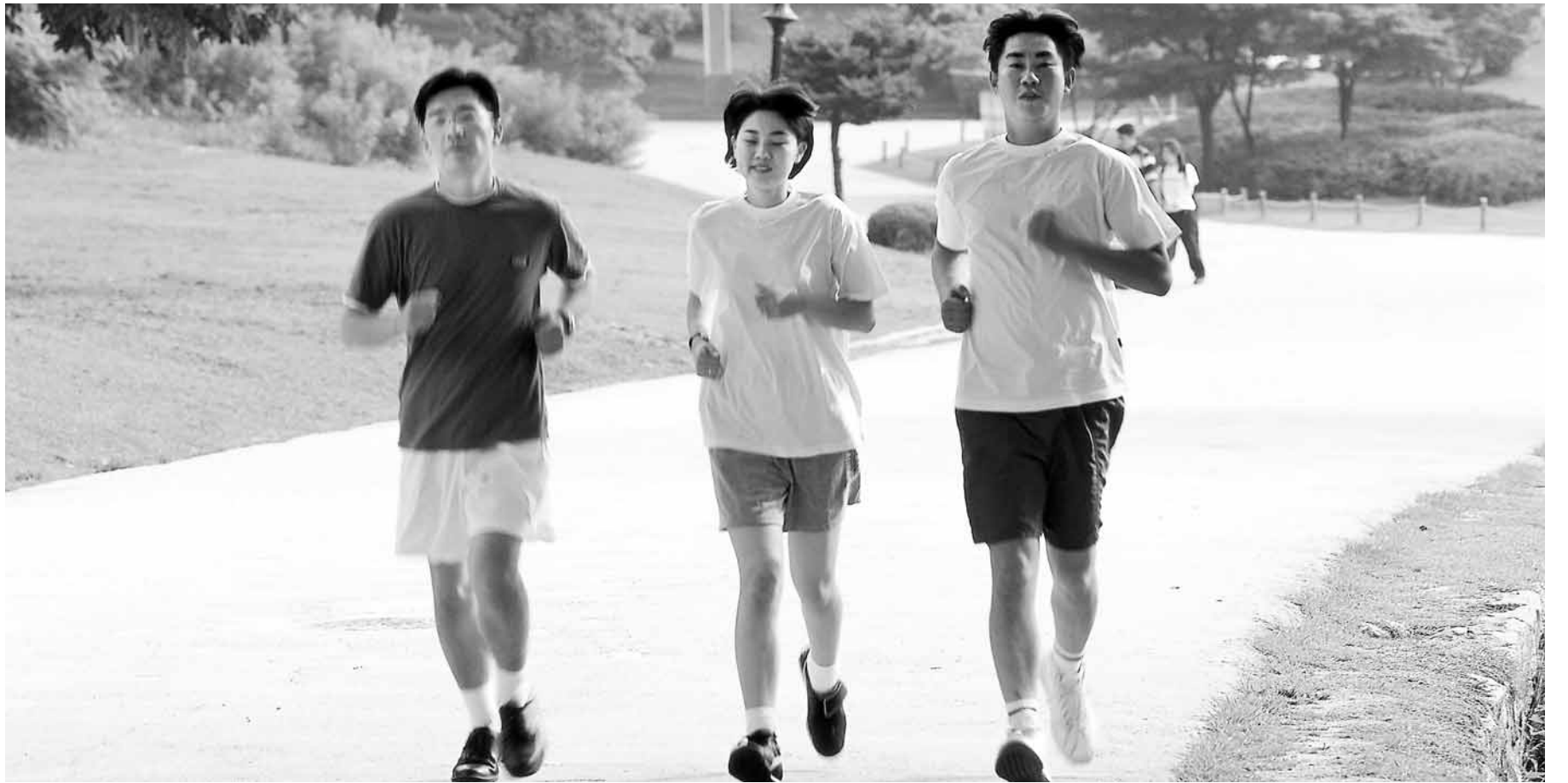
면역력 관리는 규칙적 운동, 충분한 수면을 취하는 등 평소 생활 습관에서 시작된다.

면역력 관리를 위한 두 번째 방법은 수면의 질을 높이는 것이다. 깊은 수면 중에 신체는 면역체계를 강화시켜주는 면역물질을 계속 분비한다. 그러나 경제협력개발기구(OECD) 통계에 따르면 한국인의 하루 평균 수면 시간은 7시간 41분으로 OECD 회원국 중 최하위이다. 불규칙한 생활습관과 스트레스가 원인으로 꼽힌다.