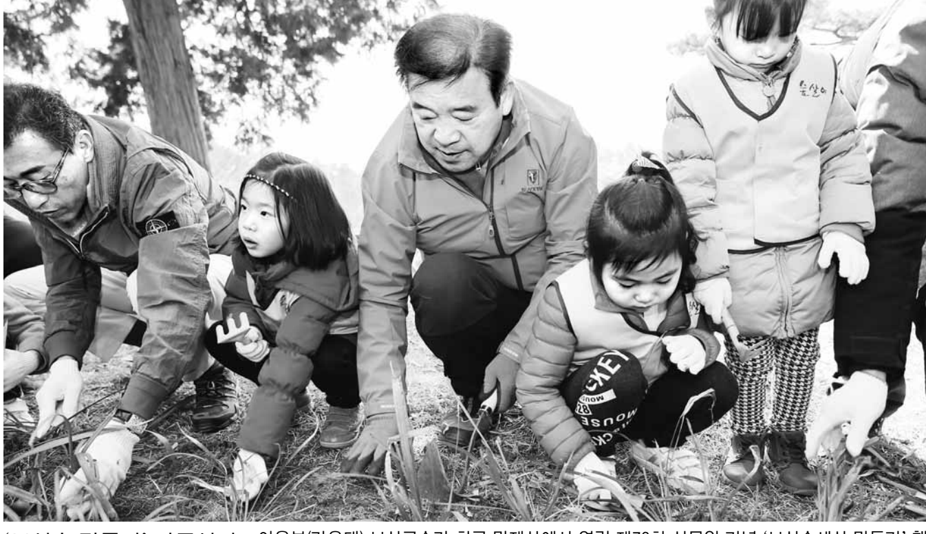
'보성숲 만들기' 나무심기 이용부(가운데) 보성군수가 최근 망제산에서 열린 제72회 식목일 기념 '보성숲세상 만들기' 행사에서 어린이들과 나무를 심고 있다.

곡성군이 '제1회 섬진강 매화꽃놀이'를 개최한다. 행사는 오는 24일부터 26일까지 3일간 매일 오후 1시부터 6시까지 압록유원지 인근 매화밭에서 진행된다. 올해 처음 개최하는 '섬진강 매화꽃놀이'는 민관이 협력하는 주민주도형 압록마을 행사로, 섬진강변에 있는 1만여평의 매화밭을 걸어보고 주민이 직접 준비한 손맛 가득한 음식도 맛볼 수 있다. 이번 행사는 섬진강과 대왕강이 만나는 두물머리로 경관이 수려한 압록유원지를 무대로 진행되며, 자세한 사항은 곡성 주민여행사 섬진강 두꺼비(010-7474-8543)로 문의하면 된다. /곡성=김계중기자 kjkim@