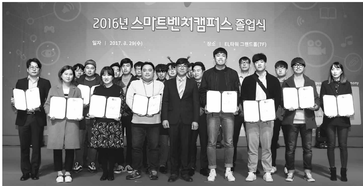
지난 29일 서울 엘타워에서 열린 '스마트벤처캠퍼스' 2016년 통합 졸업식에서 광주정보문화산업진흥원 지원 업체 졸업생들이 기념촬영을 하고 있다.