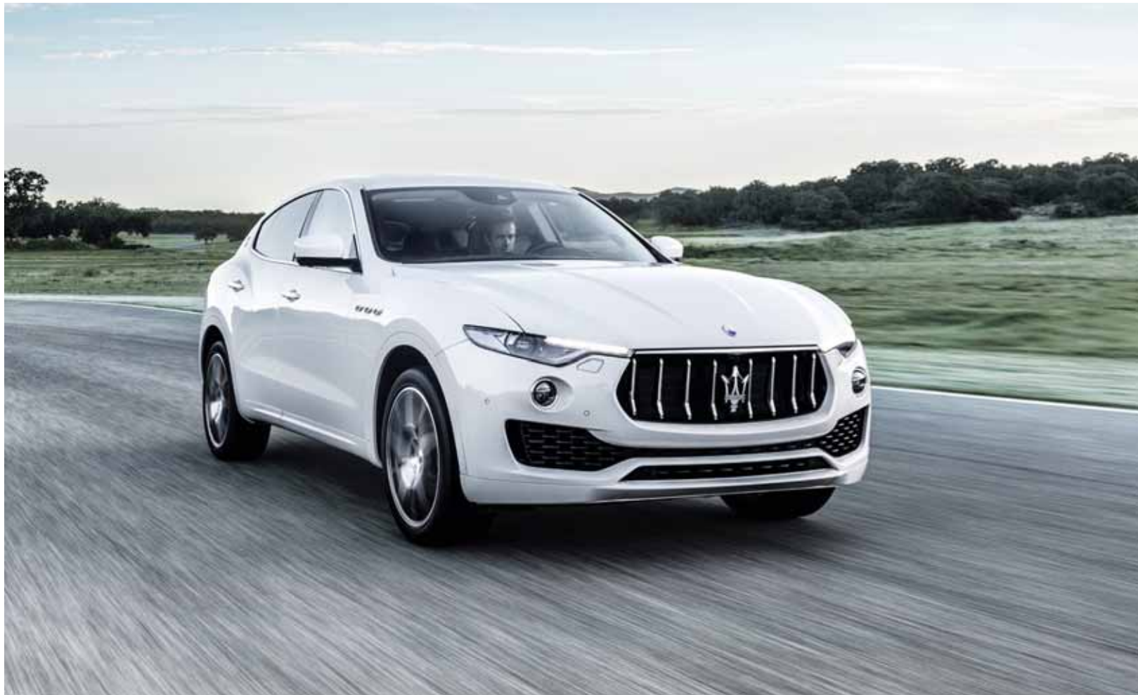
최고급 자동차 브랜드 마세라티의 최초 스포츠유틸리티차량(SUV)인 르반떼가 도로를 힘차게 질주하고 있다. 6기통 가솔린-디젤 엔진을 얹은 4륜 구동 중형 SUV 마세라티 르반떼.