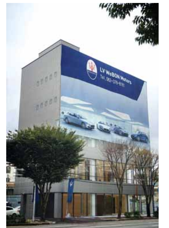
상무지구 마세라티 광주 전시장

연면적 1919㎡(약 580평), 5층 규모로 전국 최대 규모를 자랑하는 소품과 서비스센터를 함께 보유하고 있다. 특히 서비스센터를 함께 운영하고 있어 판