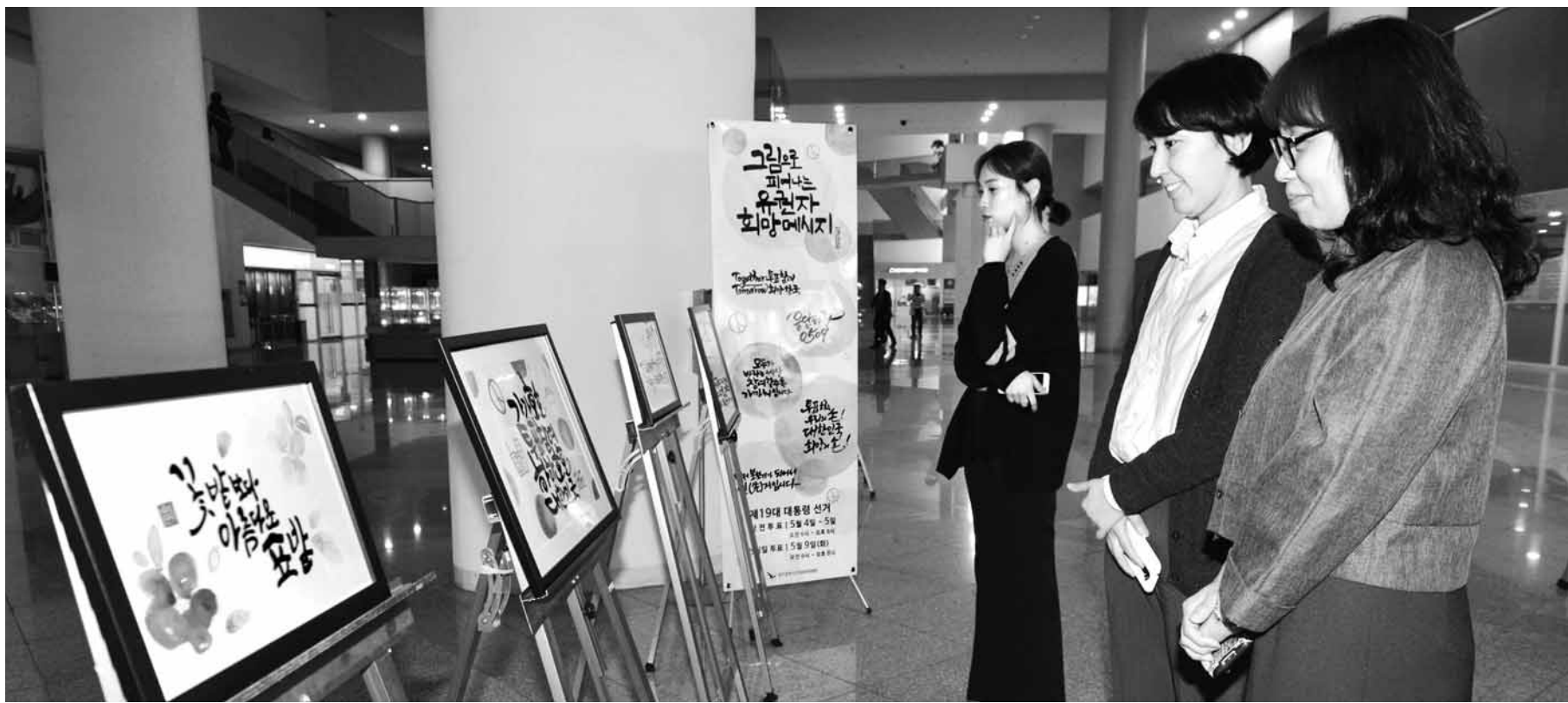
꽃보다 투표 선거관리위원회는 18일 광주시청 현관에서 대통령 선거 참가를 독려하는 캘리그래피 작품 전시회를 가졌다.

활용하고자 장애인 인권보호, 복지, 재활, 치유시설 등이 포함되는 '장애인 인권복지타운'으로 2020년까지 전국 최대 규모로 조성할 예정이다. 특히 지난해 12월부터 지속적으로 운영해온 발달장애인 복지정책 TF팀 논의 결과를 정리해 5월중 시민 공청회를 갖고, 발달장애인 자립생활 지원, 교육 제공, 일자리 지원, 안전대책 등 다양한 '발달장애인 지원 종합계획'을 확정해 하반기에는 시행할 계획이다. 이와 함께 그동안 장애인 거주시설 지원 위주로 운영했던 보호 중심의 체계에서 벗어나 장애인의 실질적인 자립생활을 지원하는 '탈시설·자립생활지원 5개년 계획'을 수립, 장애인이 비장애인들과 동등하게 살아갈 수 있도록 자립생활 주택을 지원하는 등 다각적인 지원을 확대해 나갈 계획이다. 또한, 장애인 인권보호를 위해 올 하반기에 '장애인 권익옹호기관'을 설치·운영하고, 지역 내 장애인시설 등에서 다니는 장애인의 인권이 침해당하는 일이 없도록 인권실태조사, 공익제보 양성화, 인권지킴이단 운영 등을 내용으로 하는 '장애인시설 상시 모니터링제'도 운영한다고 밝혔다. 아울러 장애인 일자리 제공을 위해 시에서 추진하는 각종 공모사업에 장애인 참여가점제도 도입, 장애인 취업박람회 확대 운영, 지역 장애인 생산품 우선 구매제도 확대 운영 등을 추진해 장애인에게 경제적 자립을 돕는다는 계획이다. /채희종기자 chae@kwangju.co.kr