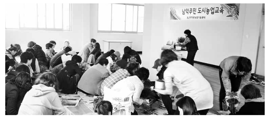
무안 남약 주민들이 무안군 도시농업교육에 참여하고 있다.

으로, 스마트폰 앱을 이용해 원격으로도 불을 점등할 수 있어 장기 출타 가정과 혼자 사는 여성의 빈집 절도를 예방에 효과적이다. 스마트 스위치 설치를 희망하는 가정은 영광경찰서에 직접 신청하면 되며, 경찰서에서 방문해 설치하는 물론 작동법까지 자세히 설명해 준다. /영광=이준용기자 jylee@