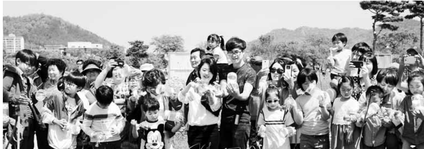
지난해 함평나비축제에서 지역민과 관광객들이 나비날리기 행사에 참여하고 있는 모습.