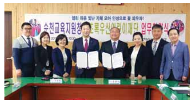
록 돕는 교육프로그램이다. 감사, 존중, 용기, 나눔 등 4가지 인성덕목을 주제로 전문활동자들이 학교에 찾아가 학급별 교육을 진행할 예정이다.

초록우산인성교육은 아동들의 눈높이에 맞는 자율적인 참여활동을 통해 ‘나와 다른 사람