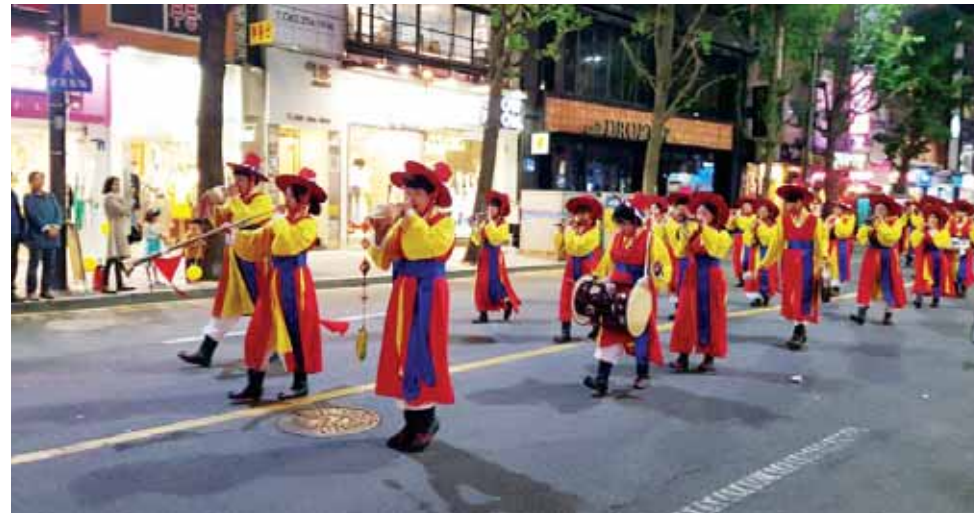
‘부처님 오신날’을 앞두고 지난 29일 광주시 동구 금남로에서 열린 광주연등축제에 참여한 정광중 대취타 동아리 학생들이 대취타와 민요를 연주하며 행진하고 있다.

이들은 지난달 해남·영광·광주에서 열린 연등축제에도 참여해 전통국악기를 연주하며 국악을 널리 알리는데 힘썼다. 앞으로 열릴 정광