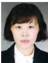
이런 주제로 우수 발표상을 수상한 바 있다.

임상의들이 기성 지르코니아 크라운 수복을 정확히 시행하기 위한 임상적 가이드라인을 제