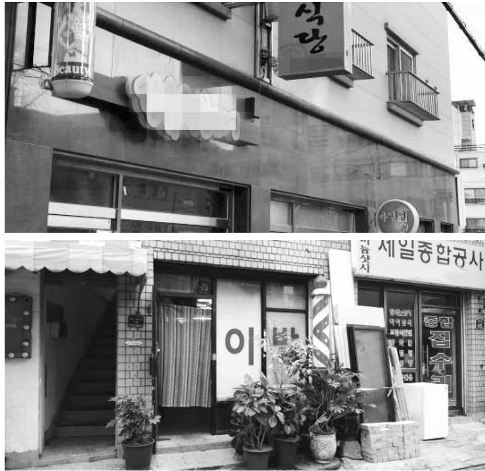
최근 창업 열기가 뜨거운 가운데 비슷한 업종인 미용실과 이발소의 희비가 갈리고 있다. 이와 비슷하게 주로 식료품과 잡화를 팔지만 편의점과 슈퍼마켓은 뜨고 식료품 가게는 지고 있는 것으로 나타났다. 사진은 기사와 관련 없음.

올해 2월 기준 목욕탕 사업자 수는 5978명으로 2년 전보다 4.8%, 1년 전보다 2.5% 줄었다. 광주는 215명에서 220명으로 전체적으로