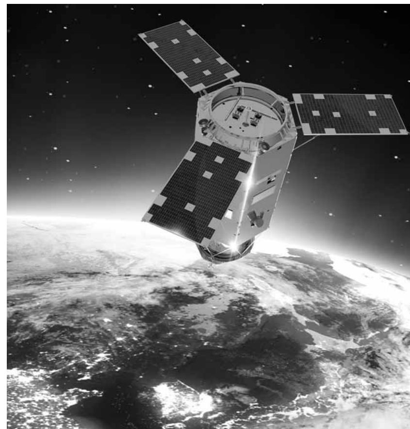
한국항공우주산업(KAI) 다목적위성 7호 상상도.