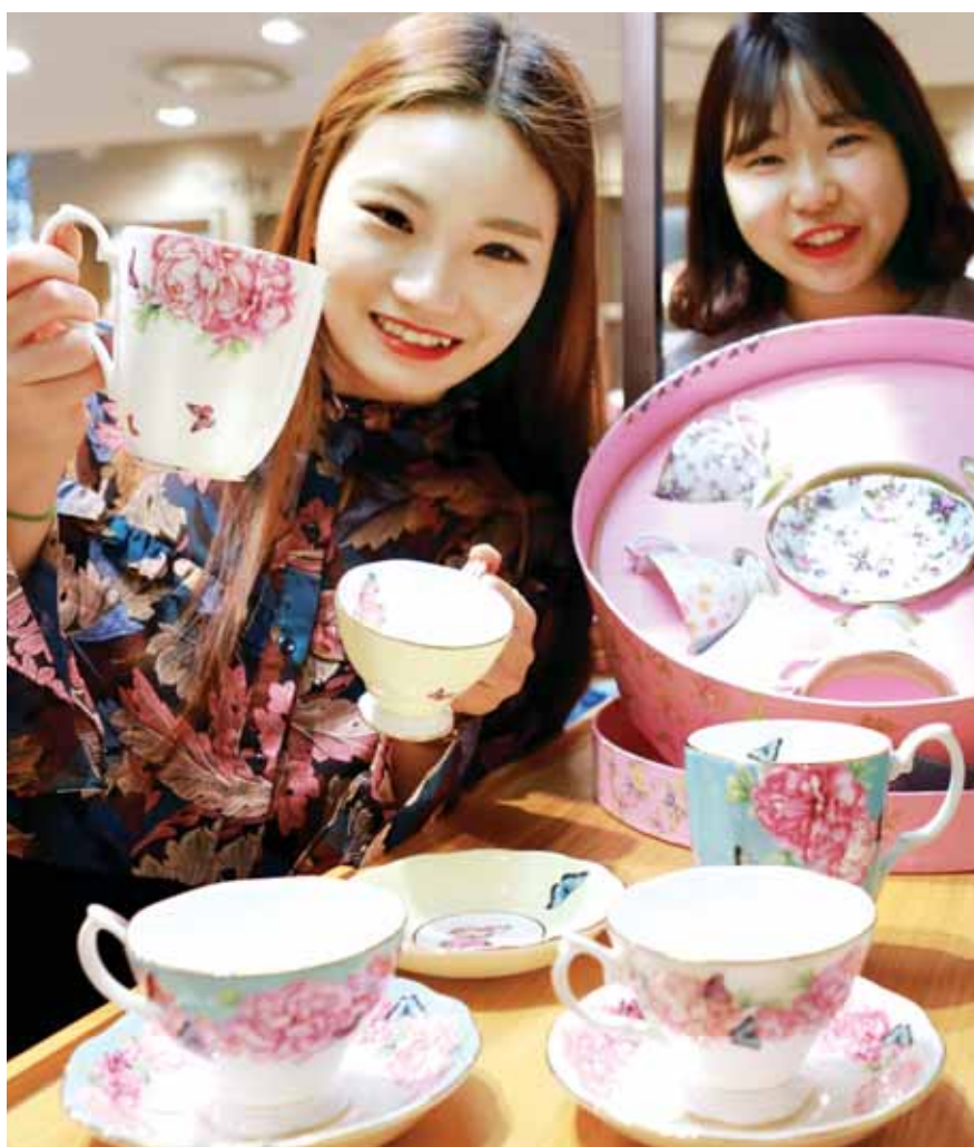
"분위기를 마셔요" 롯데백화점 광주점은 8층 로열알트 매장에서 꽃 모양이 새겨진 커피잔 세트를 선보이고 있다. 로맨틱한 디자인으로 유명한 영국 도자기 브랜드로 화려하면서도 우아함을 선사해 중년 부모님이나 은사님께 선물하기에 좋다. 9일까지 커피잔 세트를 최대 35% 할인 판매한다. <롯데백화점 제공>

금융당국은 금융소비자들이 본인의 소득 수준에 맞는 대출 한도를 쉽게 파악할 수 있도록 DSR 조희 시스템을 구축할 계획이다. /연합뉴스