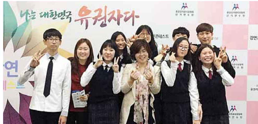
‘제6회 유권자의 날 기념 강연콘테스트’에서 우수상을 수상한 광산중학교 ‘신나고단’ 단원들.

“중요한 것은 우리 이야기를 들어주는 정치인에게 꾸준히 관심을 가져야 한다는 겁니다.