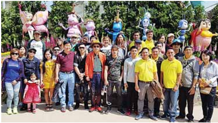
됐으면 한다”며 “앞으로도 외국인 근로자들의 고용채유 지원뿐 아니라 한국의 이미지 개선을 위한 다양한 활동을 펼치겠다”고 말했다.

광주외국인인력지원센터 관계자는 “이번 행사가 자국에 돌아간 이들이 필리핀에 한국에 대한 좋은 이미지를 전달할 수 있는 계기가