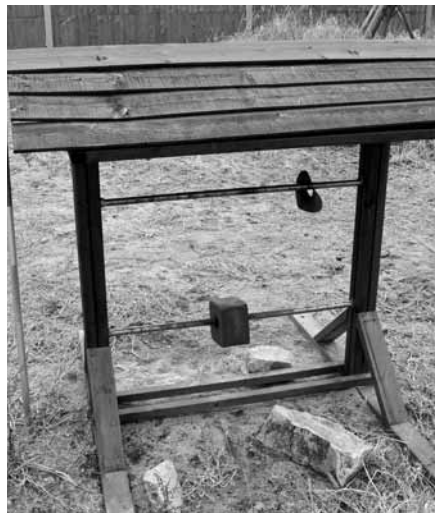
동물이 염분을 섭취할 수 있도록 생태통로에 설치된 미네랄 블록.