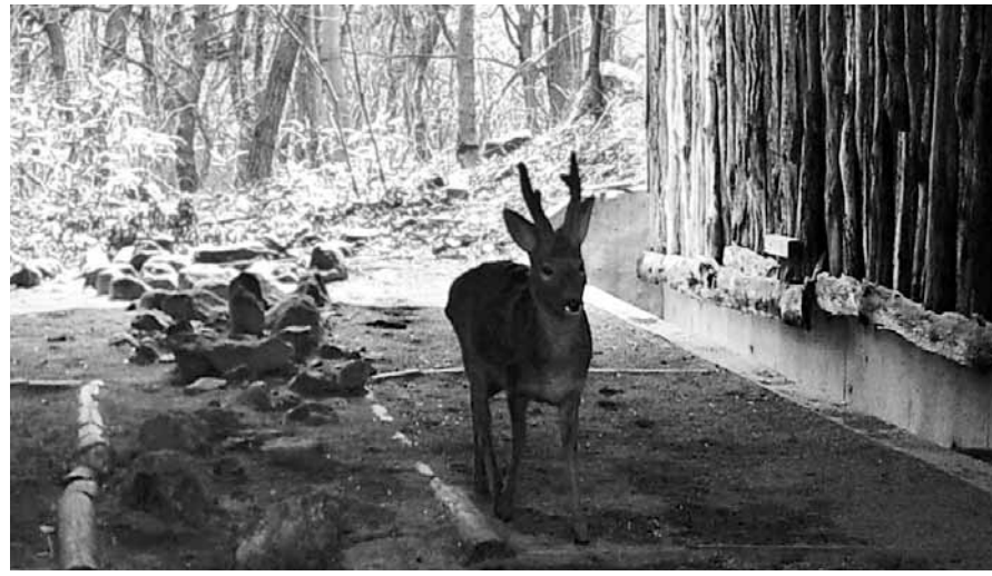
국립공원관리공단은 국립공원 곳곳에 생태통로를 설치해 야생동물의 로드킬(Road-kill)을 예방하고 있다. 노루가 지리산 시암재에 설치된 생태통로를 이용하는 모습.

그 결과 2012년 생태통로 8곳(지리산 3곳·오대산 1곳·설악산 1곳·소백산 1곳·월악산 1곳·덕유산 1곳)의 야생동물 28종 이용빈도는 1곳당 평균 163회였다. 총 이용 횟수는 1307회였다. 2016년에는 37종의 야생동물 이용빈도가 1곳당 505회(12곳 총 6061회)로 늘었다. 2012년에 비해 약