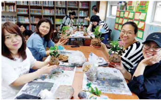
광주YWCA는 18일 광주시 광산구 수완지구 아름마을 휴먼시아3단지 도서관에서 주민을 대상으로 토피어리 만들기 체험(물 절약) 행사를 진행했다.