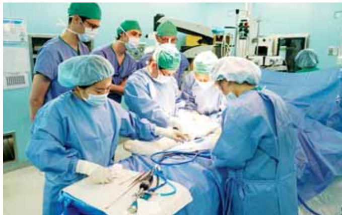
대한슬관절학회에서 주관하는 ‘2017 펠로우쉽’이 지난 17일 조선대병원에서 진행됐다.