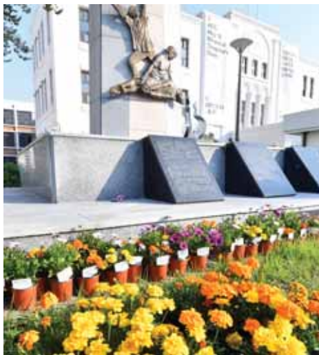
5·18항쟁 알리미 앞에 놓인 화분.

상무관, 5·18항쟁 알리미 등 사비 들여 화분 만들어 비치 광주 농기센터서 꽃 제공도 문화전당 민평 도슨트 활동