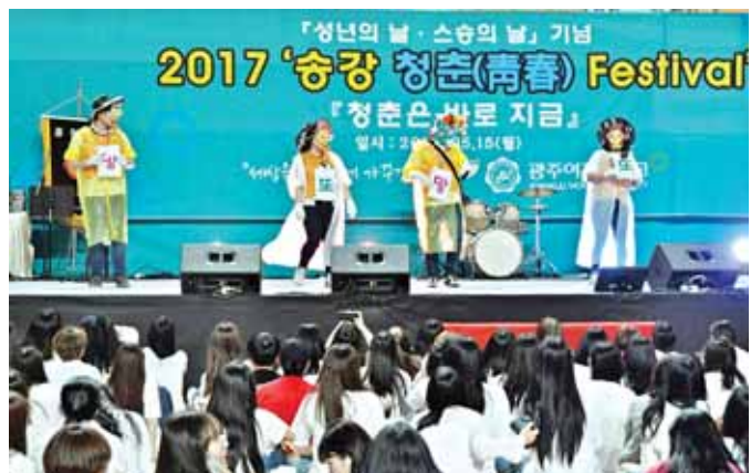
광주여대(총장 이선재)는 최근 교직원·재학생 등 3000여명이 참석한 가운데 ‘2017 송강 청춘 페스티벌’을 개최했다.