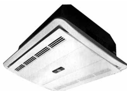
천장 매립형 공기청정·가습기.

숨튼의 제품 원리는 간단하다. 미세먼지 농도가 높은 날 비 온 뒤 공기가 깨끗해지는 것