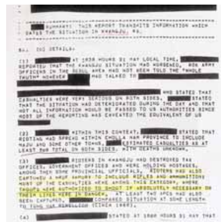
팀 서록이 광주시청에 기증한 미국 정부 기밀문서의 일부. '발포할 수 있는 권한을 승인 받았음'이라는 내용이 적혀 있다.