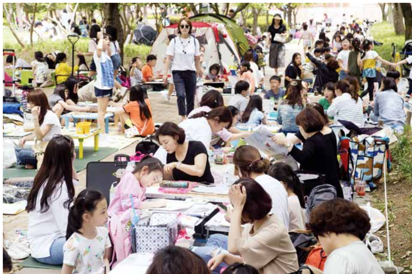
제62회 호남예술제 "나는 어린이 화가" 24일 오후 광주시 북구 우치동물원에서 열린 '제62회 호남예술제' 미술 부문에 참가한 어린이들이 5월 눈부신 신록 아래서 그림 그리기에 열중하고 있다.